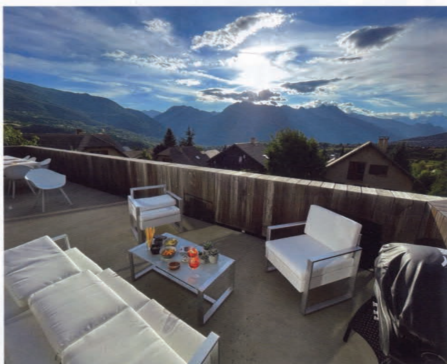
Eco Maison Bois - mars avril mai 2023

L'étage offre des espaces de vie amples, avec une cuisine, une salle à manger et un salon.