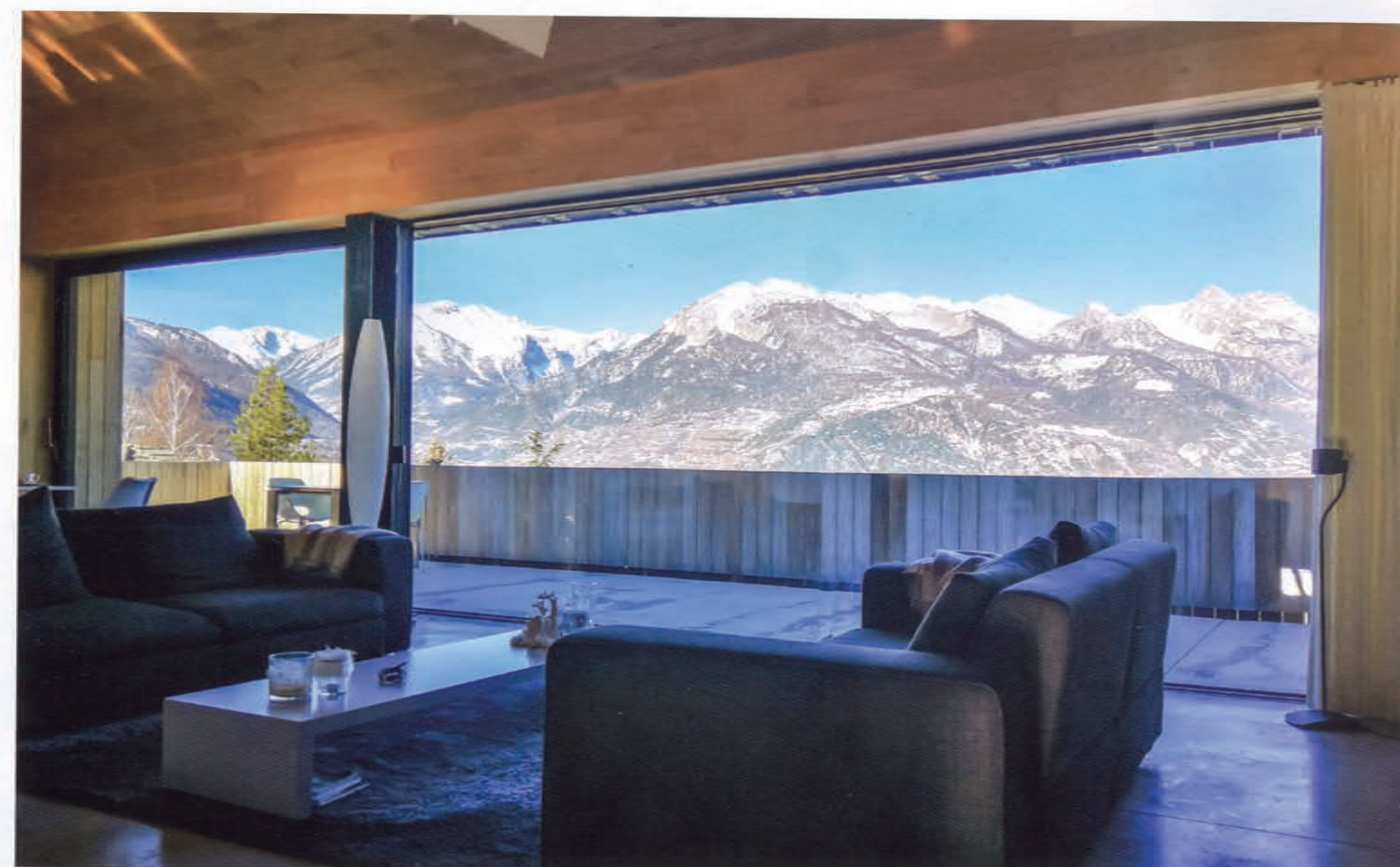
Eco Maison Bois - mars avril mai 2023